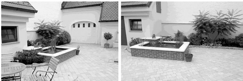
Abb. 2.3 Die umgebende optische Anordnung besteht aus Raumwinkeln unterschiedlicher Größe und Form, die sich bewegungsabhängig verändern. Der durch die Wand im Hintergrund des linken Bildes ausgefüllte Raumwinkel wächst z. B. wenn der Betrachter sich von links nach rechts bewegt. Das kann man im Bild rechts erkennen

(z. B. der Tisch im Bild links) verschwinden hingegen gleichzeitig aus dem Sichtfeld. Man kann in der Abbildung auch sehen, dass die Kacheln am Boden, als Texturelemente, in Abhängigkeit von der Entfernung der Gegenstände vom Betrachter, zunehmend dichter gepackt erscheinen.