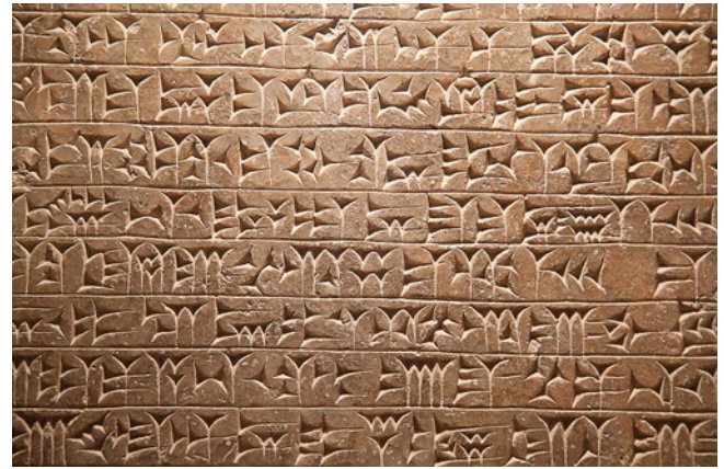
Abb. 2.2 Beispiel für die Keilschrift der Sumerer

entfernte Orte zu übermitteln, ohne auf die Merkfähigkeit von Boten angewiesen zu sein. In Mesopotamien wurde sie zur Aufzeichnung für kommerzielle Transaktionen und administrative Zwecke entwickelt. Es gab aber auch Texte, die Anleitungen zum Schreiben enthielten und der Ausbildung zukünftiger Schreiber dienten.